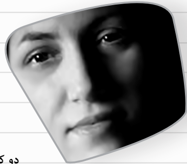
دو كورته ھەلبەستين مەھديە لەتيفى / و: پۇيىتىكا (۹۶)